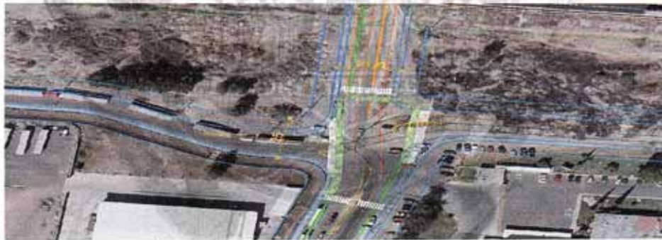
(Integración de la calle Poniente 6 y la calle Oriente 6.

SEXTO: Que el Instituto Municipal de Investigación, Planeación y Estadística (IMIPE), elaboró Oficio 586/IMIPE-TEC/2016, signado por el Arq. Sergio Martínez León, Director General del IMIPE, Dictamen de cambio de sección vial, dirigido a la Comisión de Desarrollo Urbano y Ordenamiento Ecológico Territorial, del H. Ayuntamiento respecto a la petición del cambio de sección vial para un desarrollo industrial a ser instalado en la calle Oriente 6 de la Ciudad Industrial de Celaya, Gto., de aproximadamente 1,000 mts., de longitud entre la Av. Eje Norte-Sur y la Vía del FFCC, con una sección que debería ser según el Reglamento de Ordenamiento Territorial para el municipio de Celaya, no mayor de 19m de paramento a paramento y una sección de arroyo vehicular